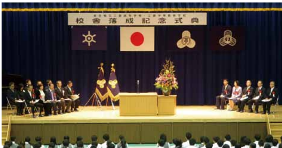
▲校舎落成記念式典が開催されました

都立三鷹高校から三鷹中等教育学校へと、学校の有の様が変わっても、刻んで来た歴史が途切れる訳ではありません。私達同窓生はあの三鷹市新川にある高校の卒業生として、その絆は続いています。これからも現役の生徒達を愛しい後輩として見守り、応援をして、新しい歴史を共に作っていききたいと思えます。三鷹高校の卒業生は、社会の広い分野で活躍しています。私達は先輩としての自覚を持ち、後輩から慕われ敬われるよう行動して行くことも必要です。我が母校がこれから刻んでいく歴史は、ただ現役生徒達だけが作るのではなく、私達同窓会も関わり、交流を深めることによって、より一層素晴らしいものへと高まっていくはずですし、そのことがまた私達同窓生が